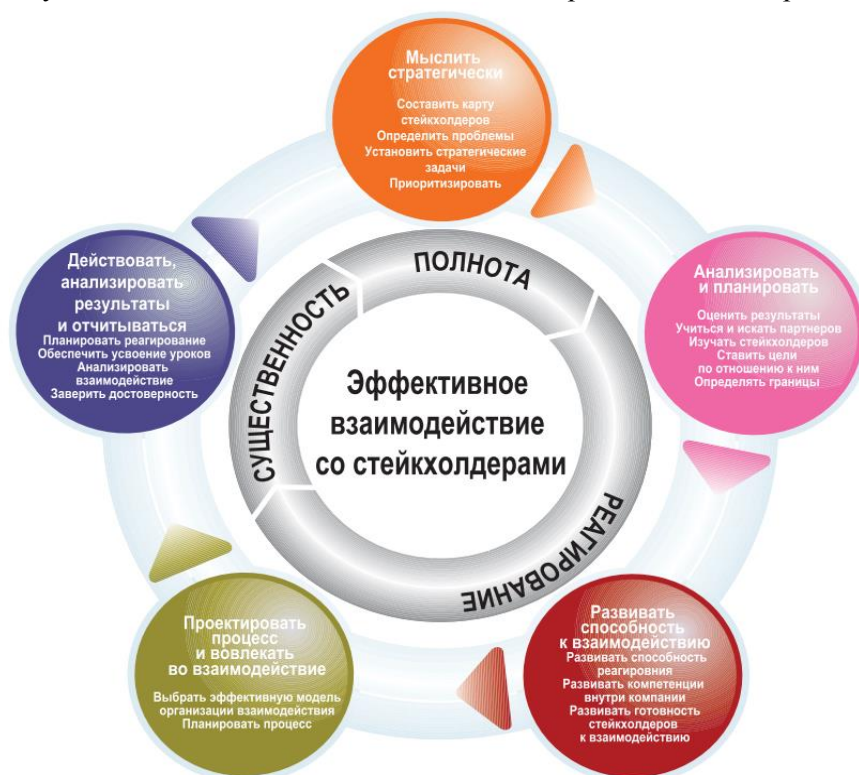
Рисунок 1. Развитие взаимодействия с заинтересованными сторонами